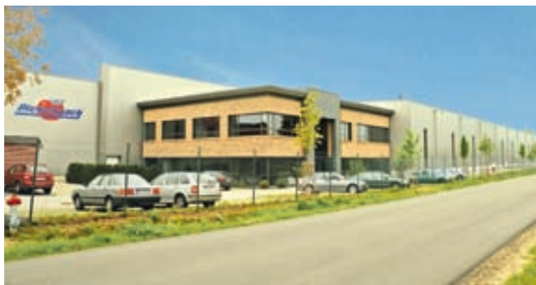
7.000 m 2 Platz: Die neue Verpackungshalle wurde 2009 in Betrieb genommen.