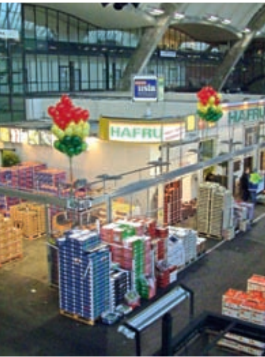
Der Stand des Unternehmens am Hamburger Großmarkt.

fert wird die gesamte Bandbreite des Handels, vom Wochenmarkthändler über kleinere Einzelhändler bis hin zu großen LEH-Ketten und Großhändlern. Sortimentsvielfalt, Frische und hochwertige Marken bieten allen Kundenstrukturen eine große Auswahl an Artikeln in verschiedenen Preissegmenten.